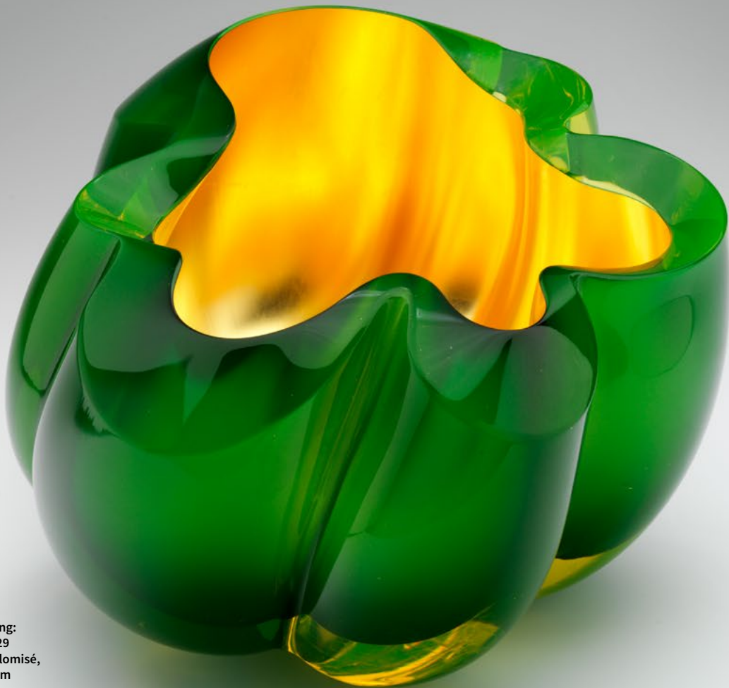
Barbara Nanning: Alexandrit 16-29 Glass, verre églomisé, h 26 x 24 x 17 cm

Besides the often spiral-like circles, in her glass works it is also the bold colors that make the artist's work so unique. Luminous reds, rich greens, daring gold, the play