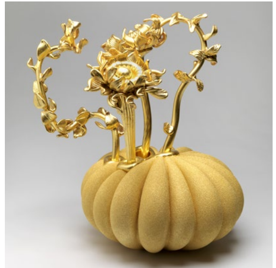
Barbara Nanning: b(L)ooming, 2012. White opaque glass, blown, sculpted, verre églomisé, h 38 x 40 x 42 cm

UPCOMING EXHIBITIONS: Coloured Shadows: Barbara Nanning, 6 February 6 – 27 March 2016, Museum Rijswijk, Rijswijk, The Netherlands. www.museumrijswijk.nl Coloured Shadows in Glass is supported through the grant program for design of the creative industries fund The Netherlands.