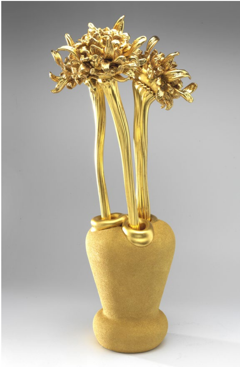
Barbara Nanning: La Pivoine II, 2012. White opaque glass, blown, sculpted, verre églomisé, h 43 x 36 x 69 cm